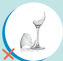
BICCHIERI E CALICI (RUR)