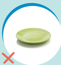
STOVIGLIE IN CERAMICA (RUR)