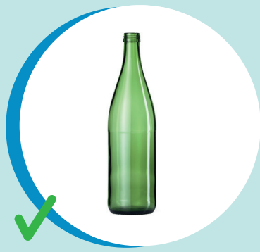
BOTTIGLIE IN VETRO