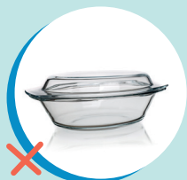
CONTENITORI IN VETRO BOROSILICATO (RUR)