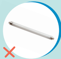
TUBI A NEON (CENTRO DI RACCOLTA)