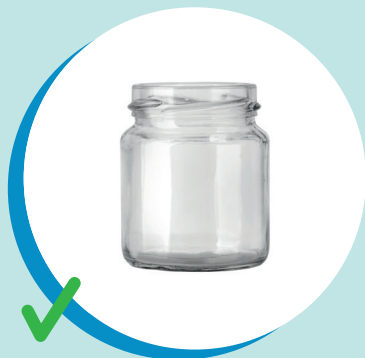
VASETTO IN VETRO