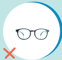
OCCHIALI DA VISTA/SOLE (RUR)