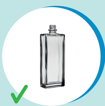
BOCCHETTA DI PROFUMO IN VETRO