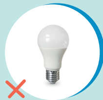
LAMPADINE (RAEE - CENTRO DI RACCOLTA)