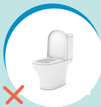
INERTI (CENTRO DI RACCOLTA)