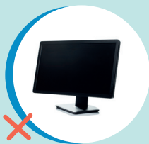
MONITOR TV/PC (RAEE - CENTRO DI RACCOLTA)