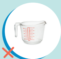
PIROFILE IN PYREX (RUR)