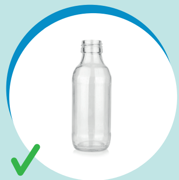
BARATTOLO IN VETRO